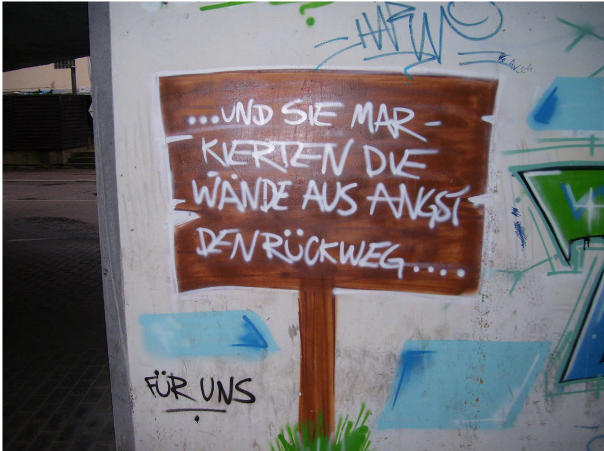
(Im Parkhaus unter dem Haus Ennepetal)

Es gibt in Ennepetal ca. 30 Spielplätze. Eine genaue Liste ist auf der Internetseite der Stadt Ennepetal zu finden. Diese werden zum Teil auch von Jugendlichen besucht. Gute Informationen erhalte ich immer wieder über den Spiel- und Bolzplatz an der Boesebecke, wo engagierte Anwohner sich einsetzen (an dieser Stelle ein herzliches Dankeschön!). Hier tauchen schon einmal Gruppen von ca. 40 Jugendlichen auf, die sich auf dem Spielplatz und an den angrenzenden Garagen treffen, trinken und Mariuhana-Produkte rauchen. Meistens verschwinden diese Gruppen aber wieder nach ca. einer Stunde und ziehen weiter, trennen sich. Während einige wieder nach Hause gehen, bewegen sich andere z.B. Richtung Busbahnhof, um von dort weiterzufahren.